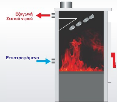
Σόμπα ξύλου "IRIS"